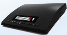
TTI STB-3772N系 (旧多チャンネルコース用STB)