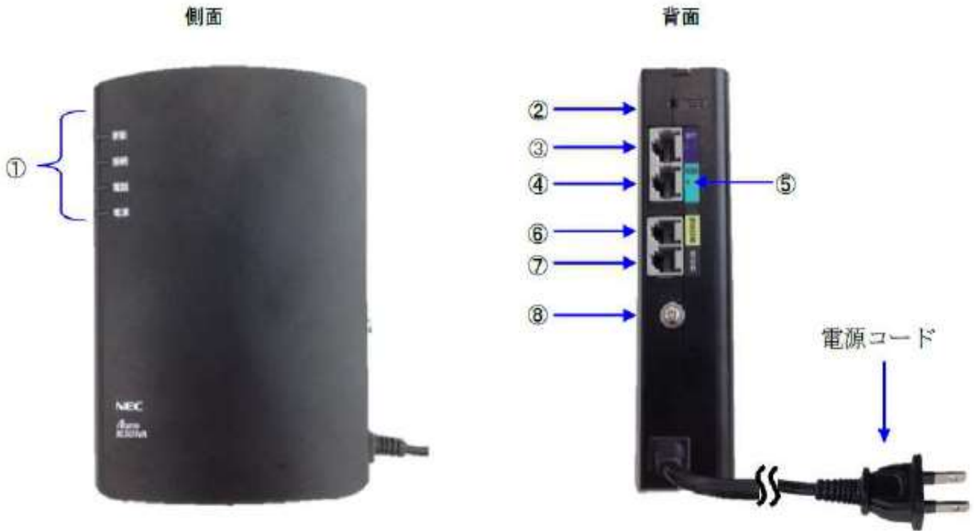
(表 1) ランプおよび端子