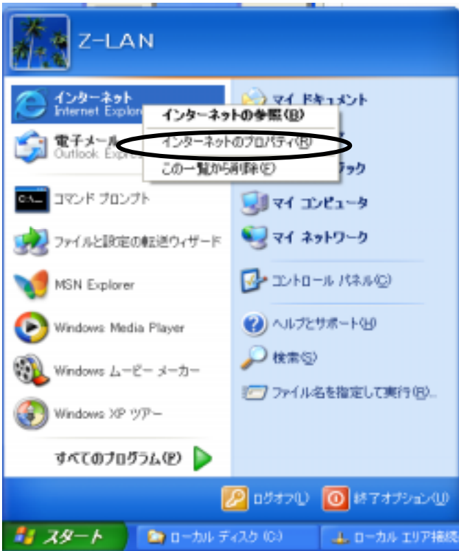
図 1 [インターネット]の右クリック